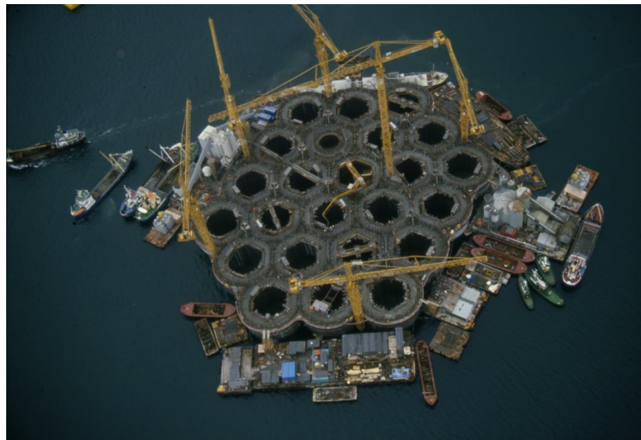
Bygging av oljeplattformen Gullfaks A.